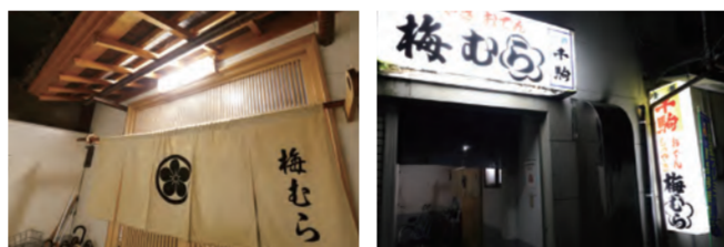
立派なれんが私達を待ち構えている。夜の町、この明かりを自印に立ち寄る人も。

まるで昭和にタイムスリップ！ 熱々おでんと焼き鳥を 熱燗でいただく幸せたるや。 店に入ると、昭和の時代に戻ったかのよ うな懐かしい雰囲気を感じた。 名物はもつ煮込みとおでん、そして炭 火でじっくり火を入れた焼き鳥だ。創 業以来注ぎ足し続けるつけだれや、黒 ごまや生姜を加えた自家製のんにく味 噌をつけて楽しめる。熱燗もいいが、レモン サワーもいい……。ほろ酔い気分になっ たら、しその実や山ごぼうといった具材で女 将さんが握ってくれるおにぎりも縮めたい。