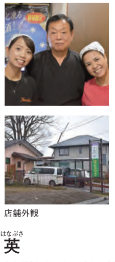
店舗外観 英 【所・間】矢吹町本町191 ☎0248-44-2562【営】16:00~23:30【休】日曜日【駐】12台