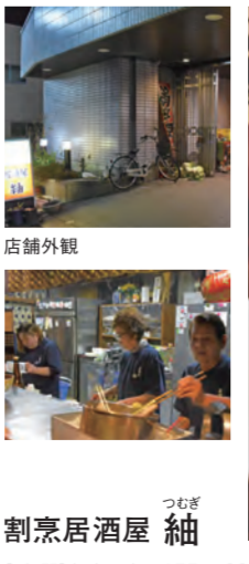
店舗外観 割烹居酒屋 紬 【所・間】矢吹町本町155 ☎0248-44-2978【営】16:00~24:00【休】日曜日【駐】5台※大型トラックも駐車可